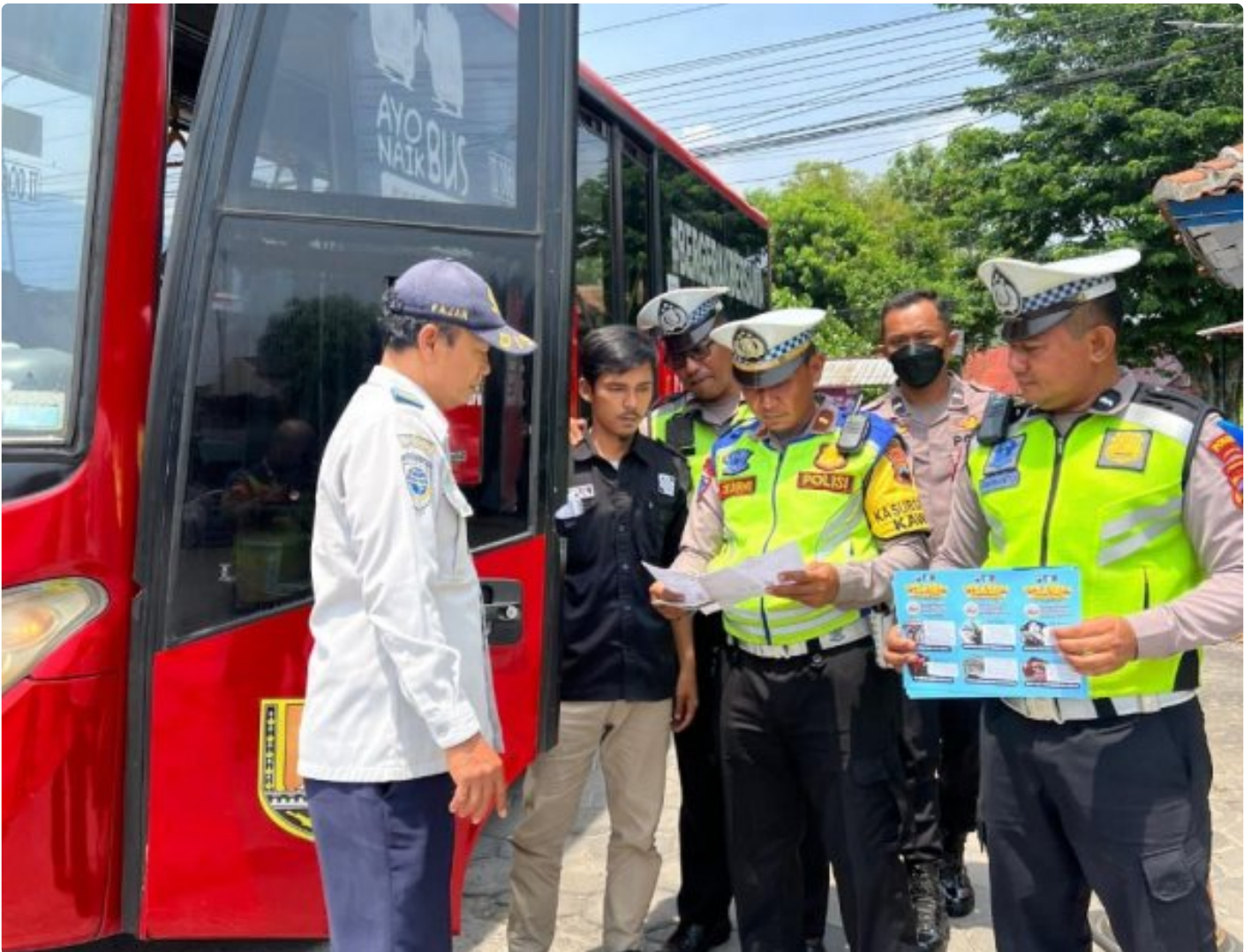
Foto: Sat Lantas Polres Semarang Polda Jawa Tengah mengadakan kegiatan Ramp Check di Terminal Cisemut, Ungaran, Kabupaten Semarang, Jawa Tengah, pada Rabu (16/10/2024).

SEMARANG- Sebagai bagian dari Operasi Zebra Candi 2024, Sat Lantas Polres Semarang Polda Jawa Tengah mengadakan kegiatan Ramp Check pada Rabu